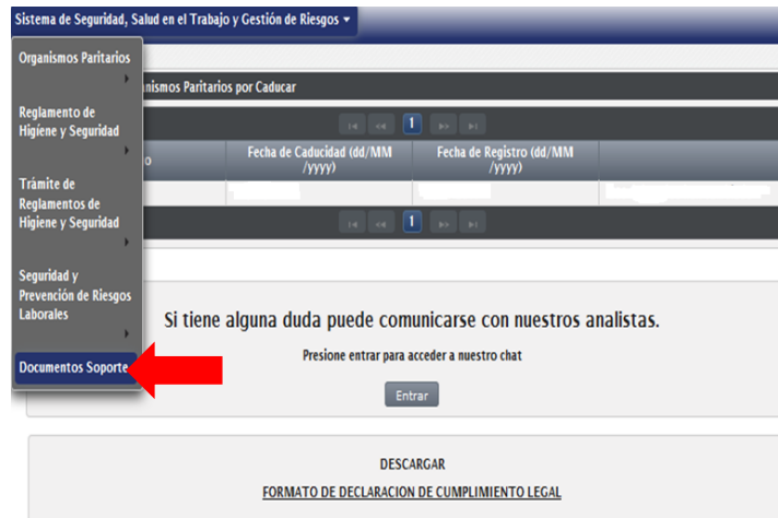
Imagen 1. Sistema de Seguridad, Salud en el Trabajo y Gestión Integral de riesgos

2. Al abrir el documento “herramienta para la tabulación de datos del cuestionario de evaluación de riesgos psicosociales”, se visualizará las siguientes hojas de cálculo: